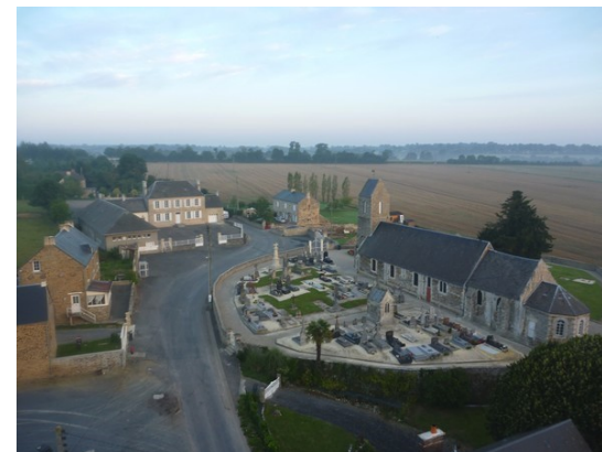
Le village de Cahagnolles)