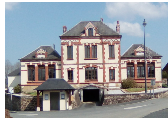
La mairie-école de Montfiquet