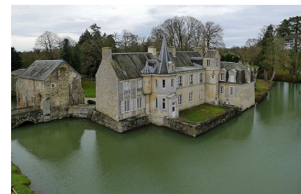
Le château de Parfouru

Variantes possibles de 9, 5,5 km et de 3,4 km