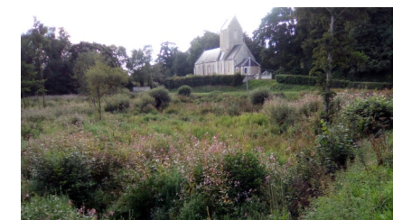
L'église du Quesnay