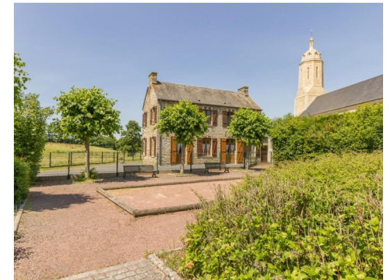
L'église et le gîte communal de Sallen