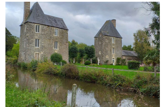
Les tours du bourg de Planquery)