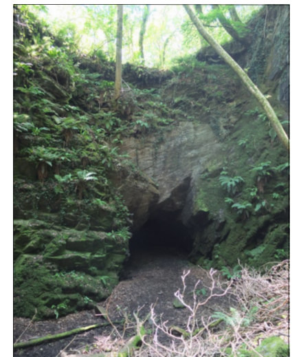
Le Trou du Diable (La Bazoque)