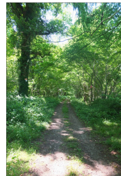
Le Bois de Baugy à Planquetry)