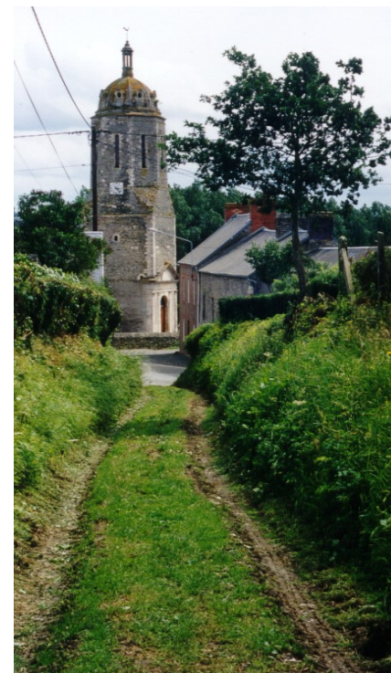
Eglise de Sallen