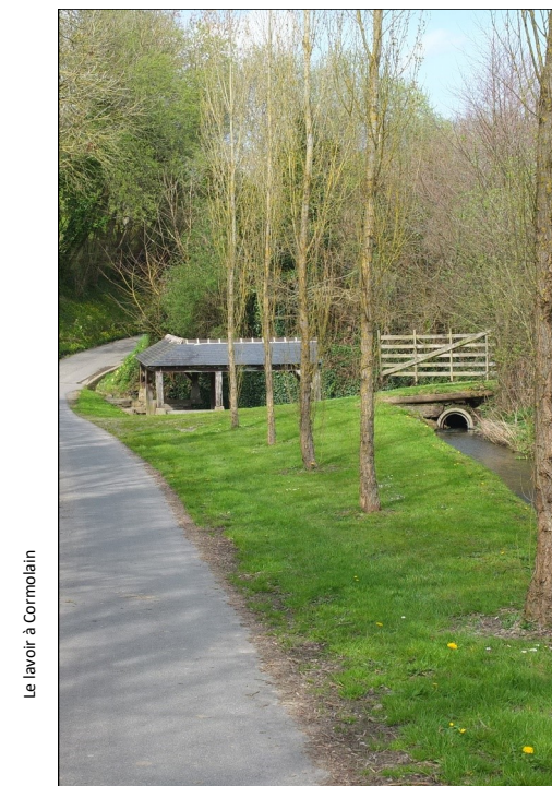
Le lavoir à Cormolain

Circuit et dépliant créé avec les élèves de 6e A du collège les Sources d'Aure en 1994