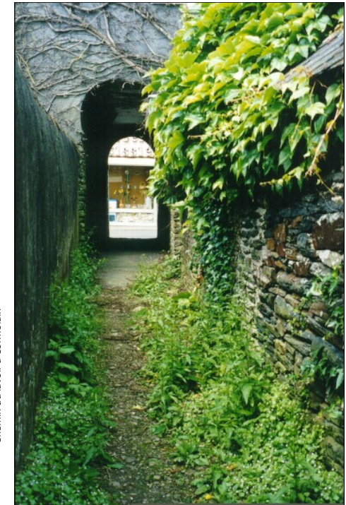
Chemin du lavoir à Cormolain

Circuit et dépliant créé avec les élèves de 6e A du collège les Sources d'Aure en 1994