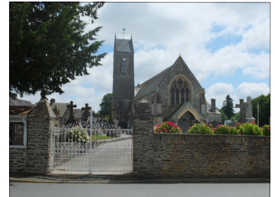
Église de Cormolain